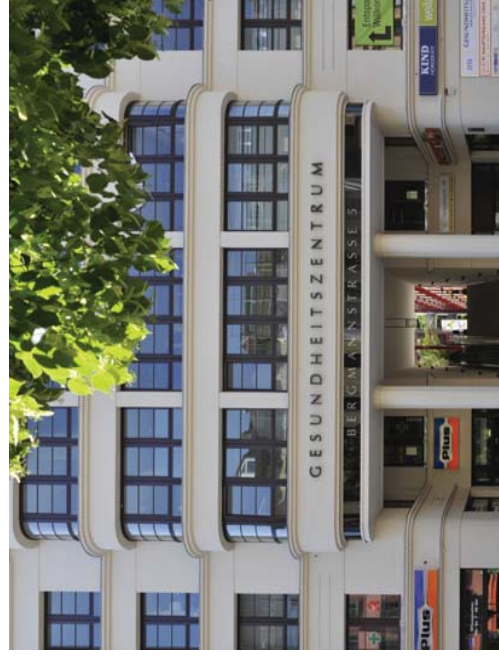
Ärzte- und Gesundheitszentrum Bergmannstraße, Berlin-Kreuzberg

Auftraggeber: IVG/Tercon, ECE, TLG, Bauwert, Stoffel Holding, HPE Development, Senat von Berlin, Stadt München, Laguner GmbH, Werkkonzept Berlin, HOCHTIEF Development HIP, Concept Bau I Premier Deutschland GmbH, Polo Potsdam, Frankonia, JK Wohnbau, Pandion, Corpus Sireo, Vivantes GmbH, Prowo GmbH, Privatbauherren in D/F/CH.