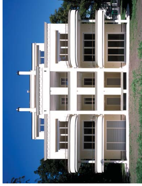
Wohnhäuser Delbrückstraße, Berlin-Grünewald